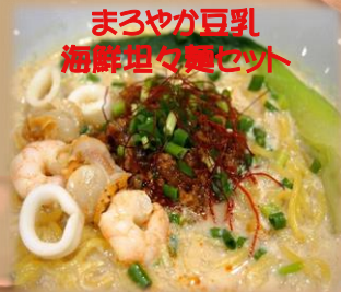
まろやか豆乳 海鮮坦々麺セット ¥890(ドリンクバー付き)