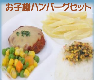
お子様ハンバーグセット ¥320(お子様ドリンクバー付き)