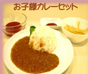
お子様カレーセット ¥320(お子様ドリンクバー付き)