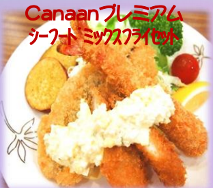
Canaanプレミアム ソフト ミックスフライセット ¥900(ドリンクバー付き)

ボリュームたっぷりの160gのハンバーグに、きのこ仕立ての甘辛和風あんかけダレを存分に降り注ぎました。きのこの歯応えと風味豊かなあんかけダレに、爽やかな大根おろしや大葉の風味がマッチします。薩摩芋を始め付け合わせの温野菜と共に、溢れる肉汁をお楽しみ下さい。