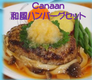
Canaan 和風ハンバーグセット ¥830(ドリンクバー付き)

コシのある中華麺に、擦り胡麻の香る風味豊かでまろやかな豆乳スープを合わせ、豚挽と刻み搾菜を始めとする香味野菜で仕上げた甘辛肉味噌をトッピングし、海鮮やお野菜を添えて仕上げました。辛味が苦手な方にもお召し上がり頂けるよう辣油はお好みで後がけして頂くスタイルです。